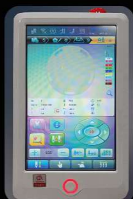
Шаг 4: статус вышивки в реальном времени

Интуитивно понятный интерфейс и широкий функционал