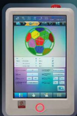
Шаг 2: редактирование