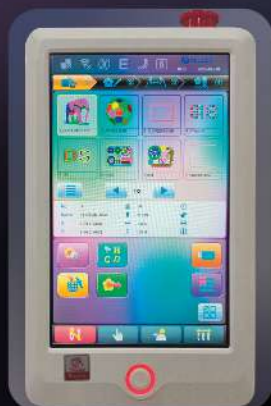
Удобное хранение и выбор файлов из библиотеки

Интуитивно понятный интерфейс и широкий функционал