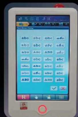
Возможность вышивки текста на прямую из пульта машины