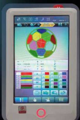
Шаг 3: выбор игл/цветов