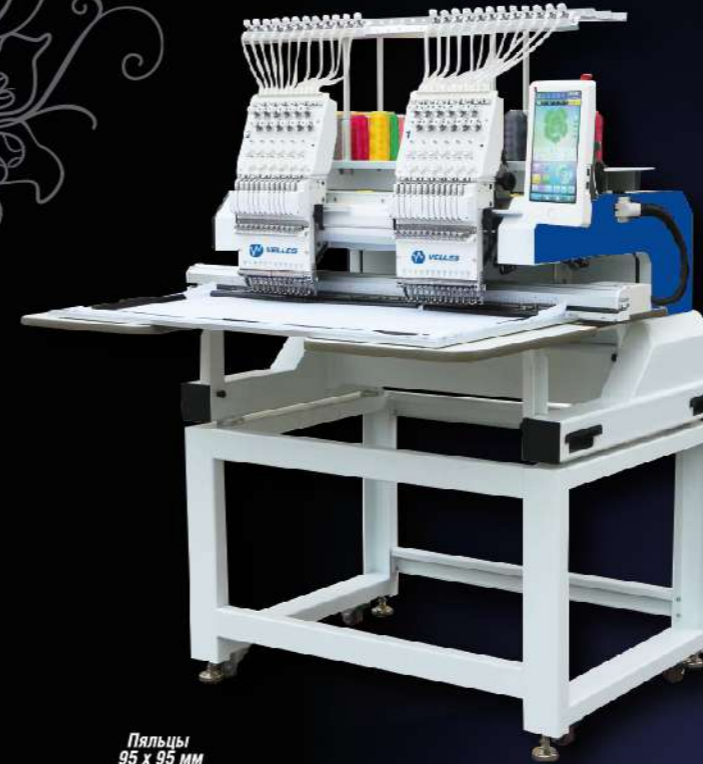
VELLES VE 1502C-TS2 FREESTYLE (450 x 400 мм)