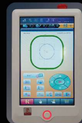
Расположение дизайна в пяльцах / центрирование