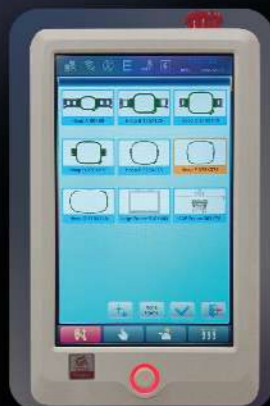
Выбор предустановленных размеров пялец