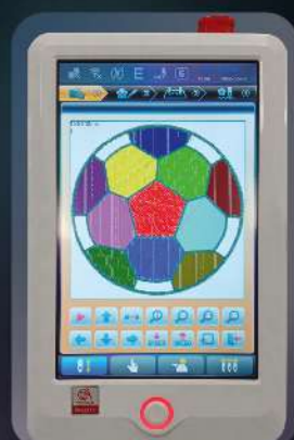
Шаг 1: превью дизайна

Запуск дизайна на вышивку в 4 простых последовательных шага