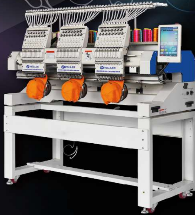
VELLES VE 1503C-TS2 FREESTYLE (400 x 400 мм)

ОТЛИЧИТЕЛЬНОЙ ОСОБЕННОСТЬЮ СЕРИИ FREESTYLE ЯВЛЯЕТСЯ СВОБОДНАЯ ПОДВЕСКА ВЫШИВАЕМОГО ИЗДЕЛИЯ. Точки крепления пальцев находятся выше плоскости вышивки, поле вышивки не ограничено боковыми опорами пантографа. Пространство под пальцами позволяет вышивать на тяжелых готовых изделиях «на весу».