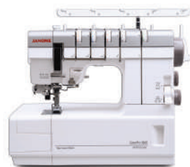
CoverPro 3000 Professional