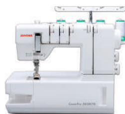
CoverPro 7 PLUS